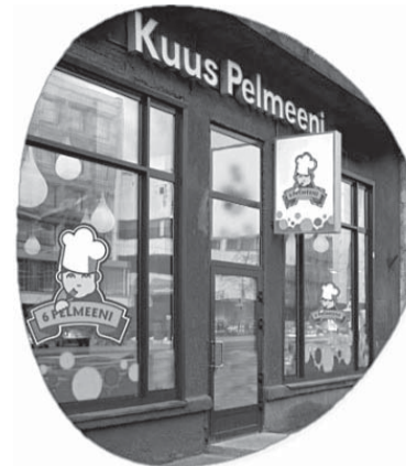
Pelmeenikohvik Kuus Pelmeeni.

Sauna tänavale on peidetud pisike pelmeeni- ja sõõrikukohvik, mis tihti oma lihtsuses möödajatele märkamatuks jääb. Aga need, kes juba kohaga tuttavad on, astuvad sellest uksest sisse üsna tihti. Nimelt on EAT ödus ja väike kohvik, kus saab odavalt maitsva kõhutäie. Ka siin saab süüa erinevaid pelmeene (lihaga, spinatiga, kartuliga, kirsiga jne) ning 100 grammi maksab 10 krooni. Kui aga pelmeenidest juba isu täis, siis pakub kohvik ka 35 krooni eest päevapraadi, 20 krooni eest suppi ja 12 krooni eest kooki. Söögikohas EAT on tõesti odavad hinnad ja tihti leiavad sinna oma tee ka just nimelt seljakotiga rändavad välismaalased. Nemad