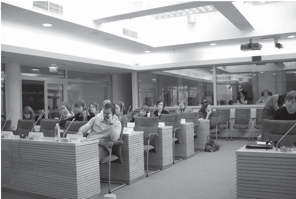
Kabiinides tõlgitakse ja ees kuulatakse.