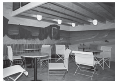
The Lost Continent.

The Lost Continent asub ülikoolist vaid paari sammu kaugusel. Ennast reklaamib söögikoht kui ainust austraaliapäras baari ja restorani Eestis, kus võib avastada